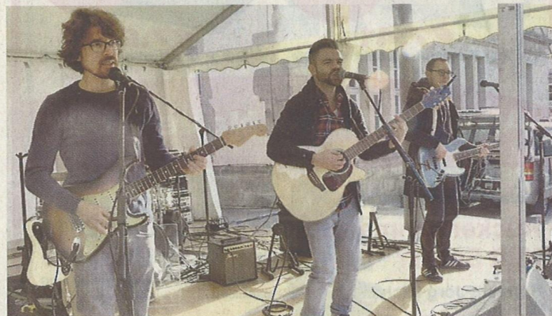
Sorgt für gute Laune: Die Band „Goodbeats“ aus Paderborn.