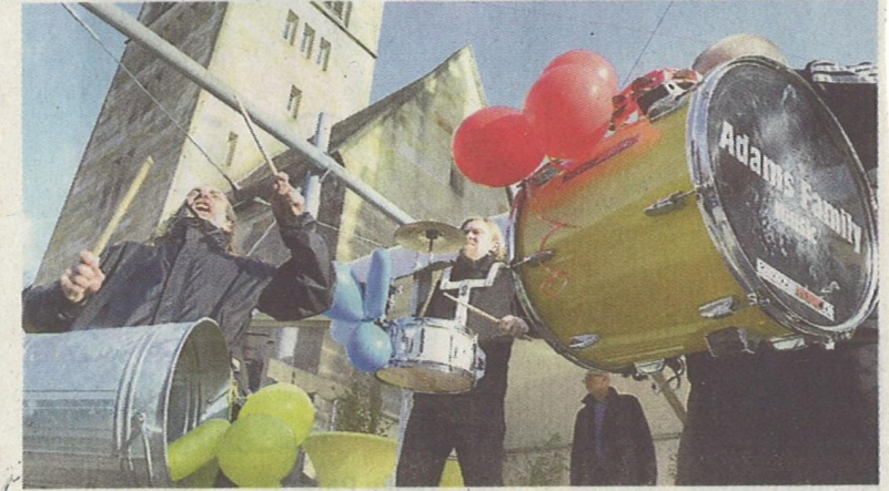
Sie geben den Takt an: Der Feuerwehr-Musikzug Dinklar.