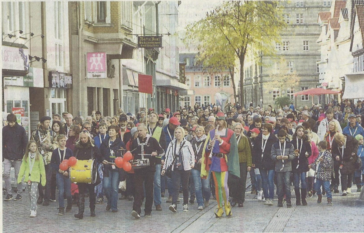
Unterwegs auf der „Roten Route“ – und der Rattenfänger vornweg.