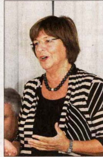
Die ehemalige Gesundheitsministerin Ulla Schmidt, Schirmherrin des Projekts „Länger besser leben“.